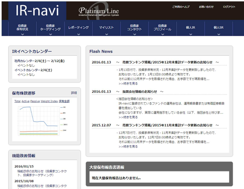
【図 3：「IR-navi」システムの新しい TOP 画面のイメージ】