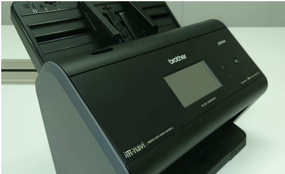
【図 2：名刺スキャナー】